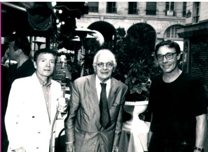
Roger Peyrefitte, auteur de la préface de l'album « Un siècle de nu masculin ». A dr. Jean-Daniel Cadinot roi du X gay.

Premier petit rôle au cinéma dans « Olivia » avec Edwige Feuillère.